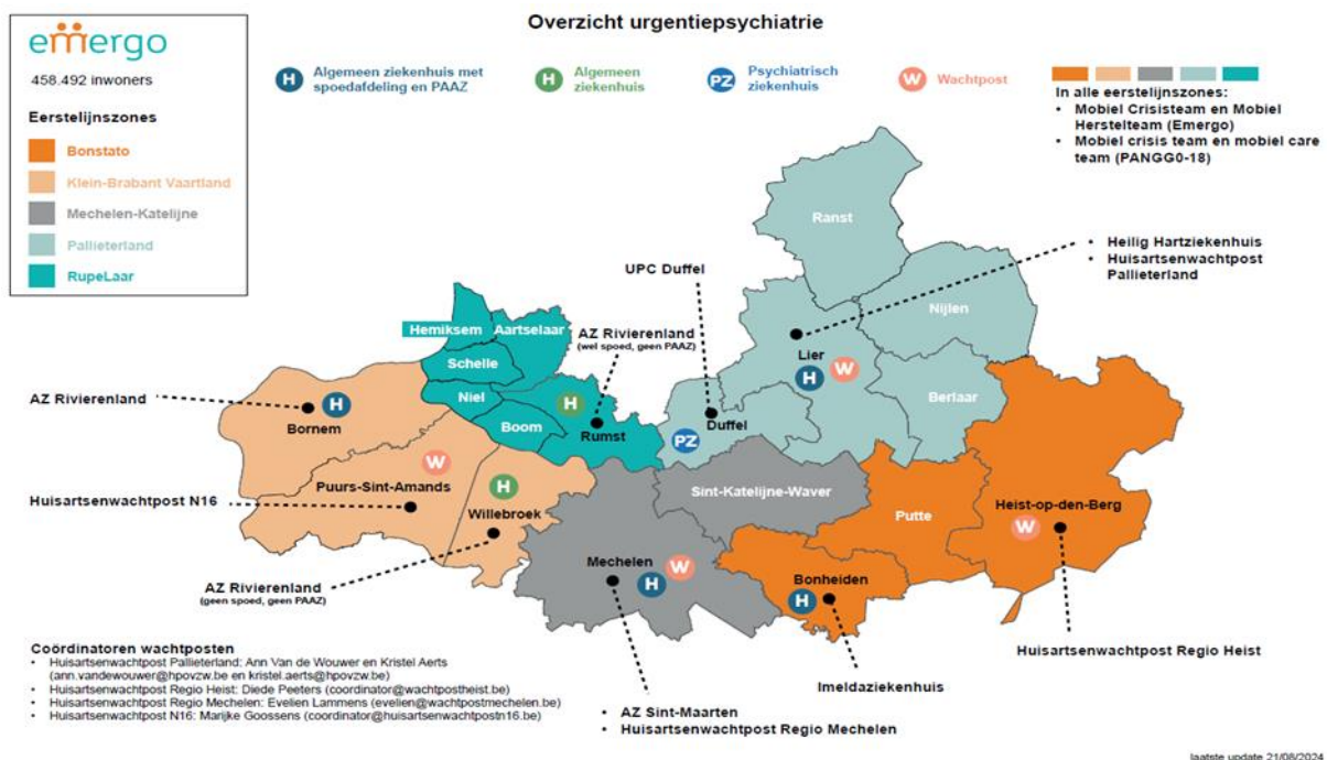
Figuur 1: voorzieningen urgentiepsychiatrie